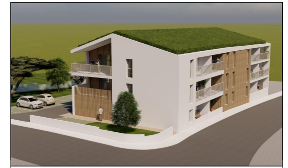
MAITRISE D'OUVRAGE L'HABITAT